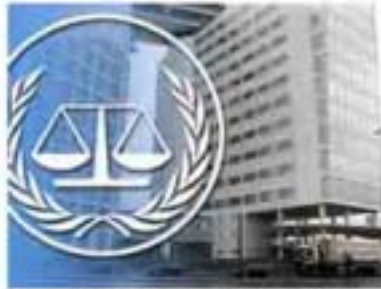
Edificio del ICC La Haya, Holanda